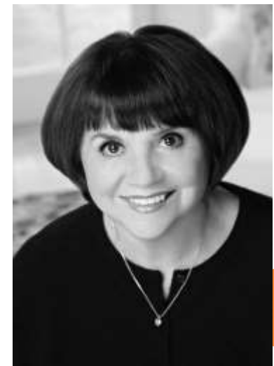
Linda Ronstadt (chanteuse)