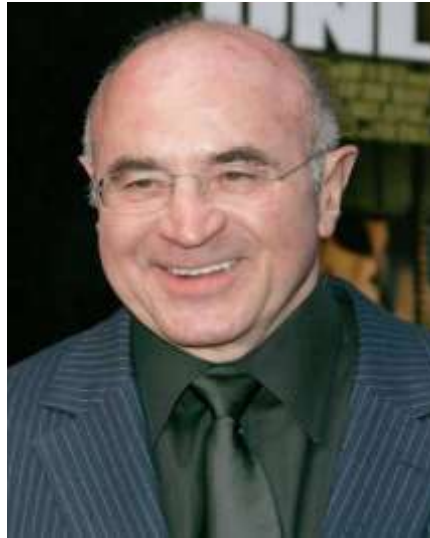
Bob Hoskins (acteur)