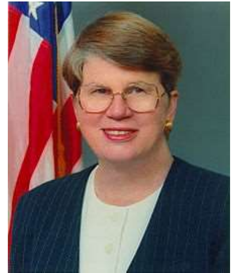
Janet Reno (avocate)