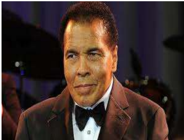
Muhammad ALI (boxeur)