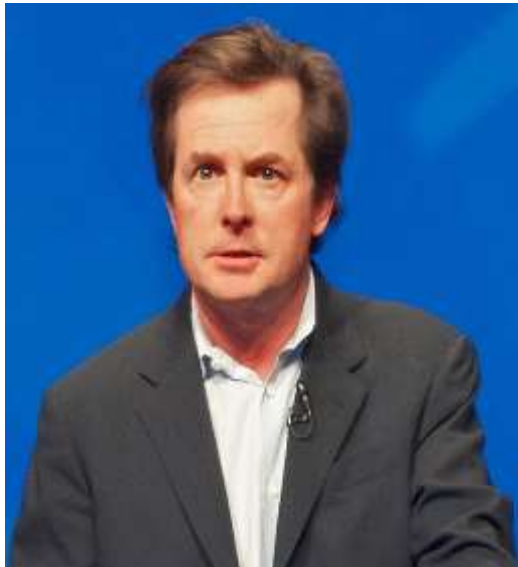
Michael J. Fox (acteur)